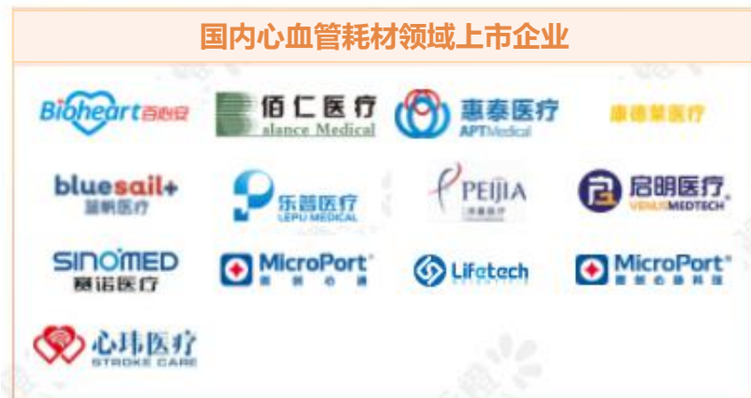
国内心血管耗材领域上市企业