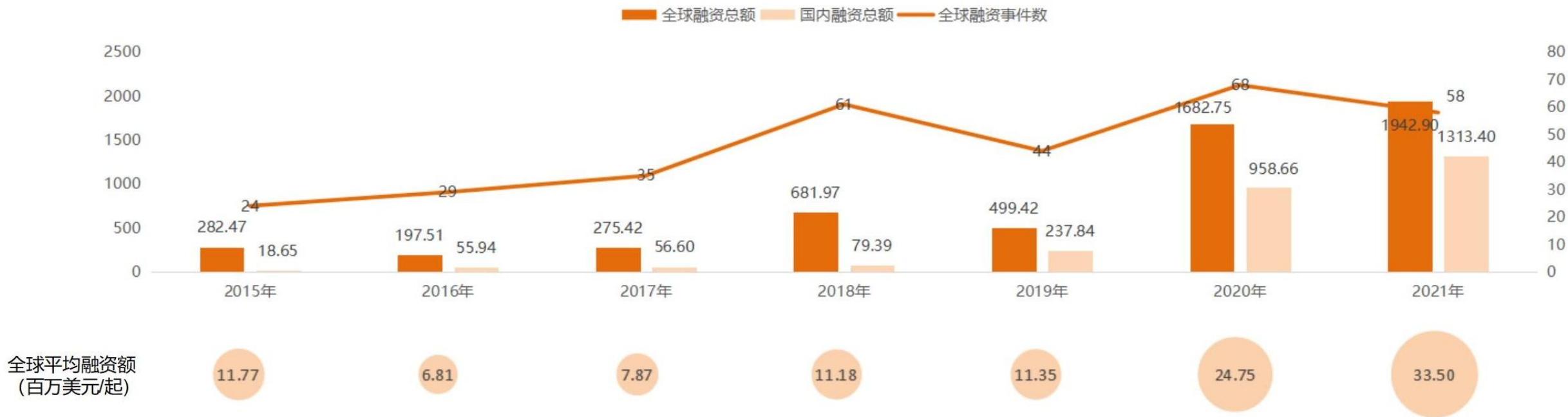
2015年-2021年心血管耗材领域融资情况 (单位: 百万美元)