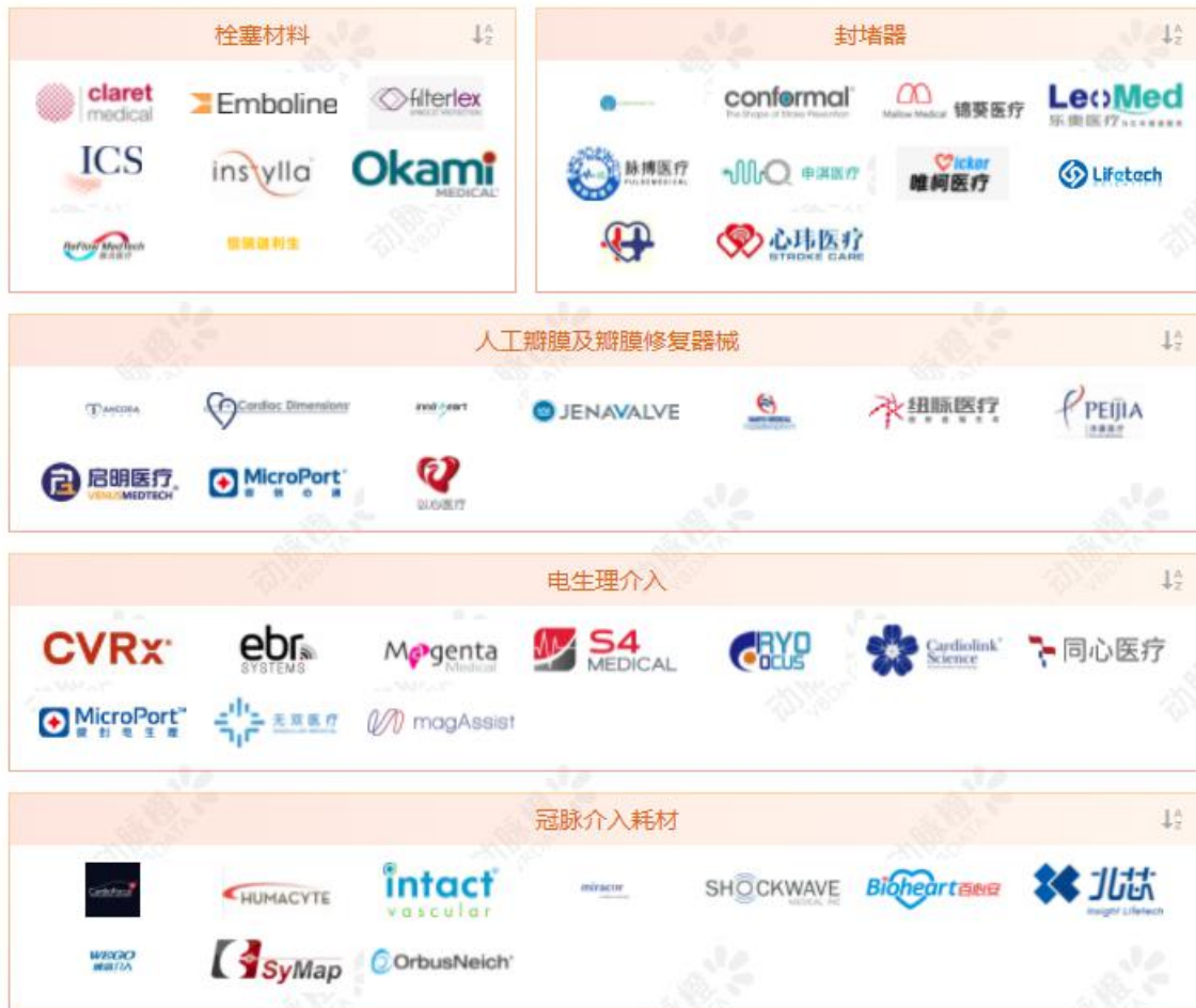
全球心血管耗材领域产业图谱