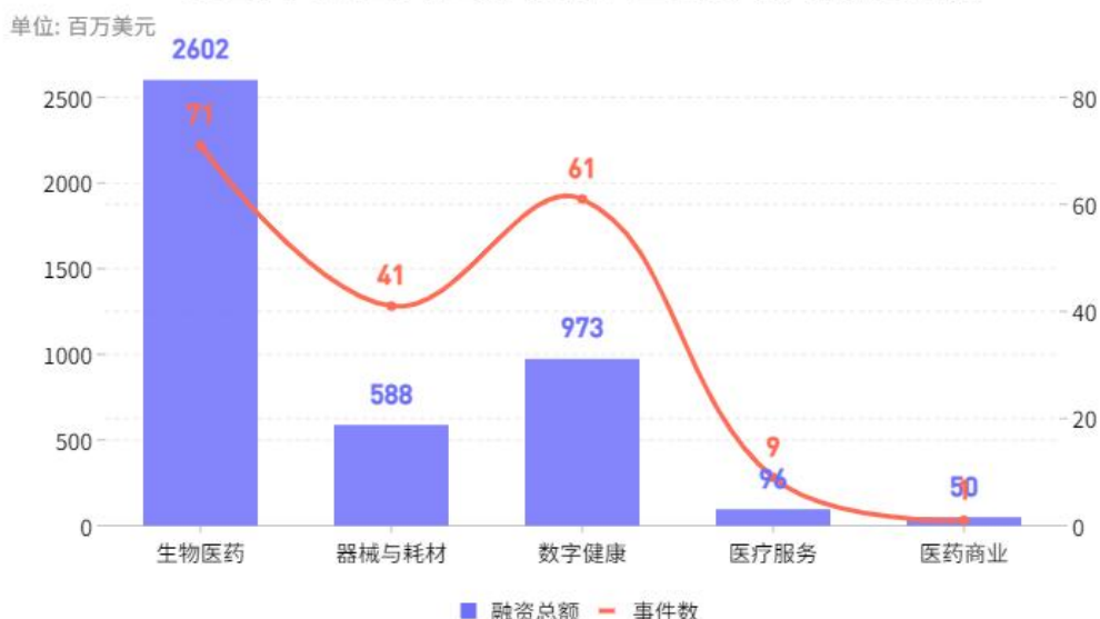
2024年5月全球医疗健康产业细分领域融资情况

值得一提的是,免疫和炎症疾病治疗药物研发商 Uniquity Bio 获得 3 亿美元融资,一举拿下本月融资榜首。Uniquity Bio 正在积极建立免疫学和炎症产品线,它的第一个主要资产是 solrikitug,这是一种靶向 TSLP 的单克隆抗体。Uniquity Bio 计划通过 solrikitug 在多种呼吸道和胃肠道适应症中提供一流的疗效,目前 FDA 已接受该药物的 2 期研究性新药 (IND) 申请。6 月,Uniquity Bio 将启动慢性阻塞性肺疾病 (COPD) 的 2 期临床试验。