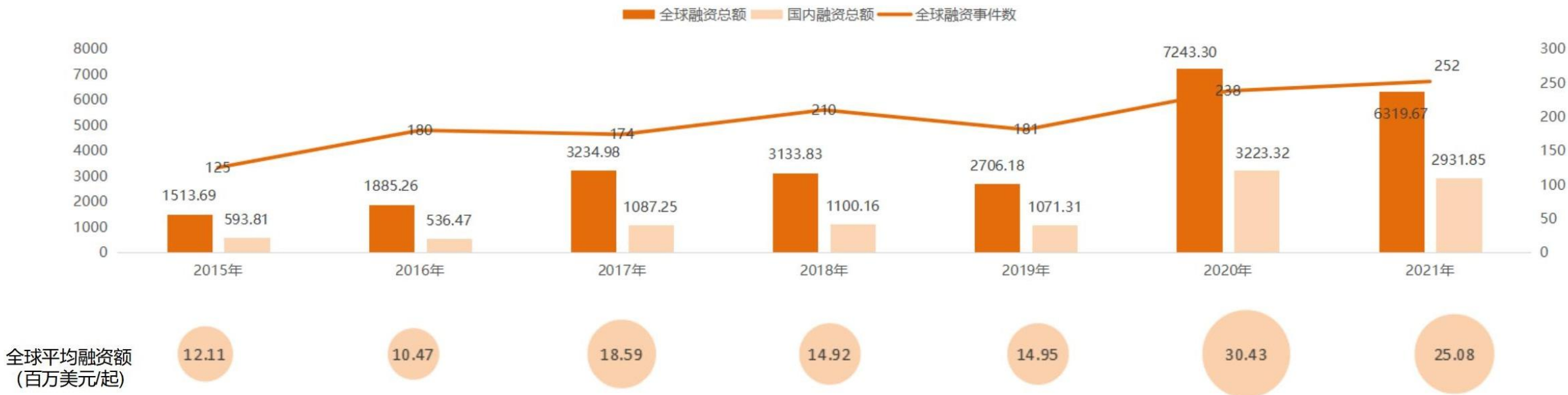
2015年-2021年IVD领域融资情况 (单位: 百万美元)