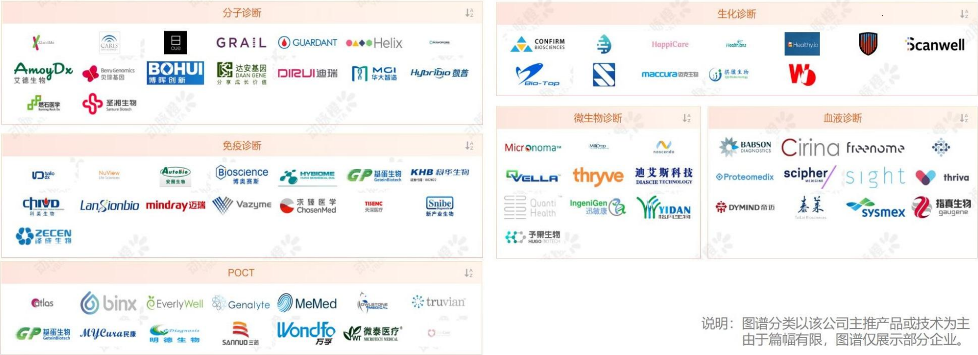
全球IVD领域产业图谱